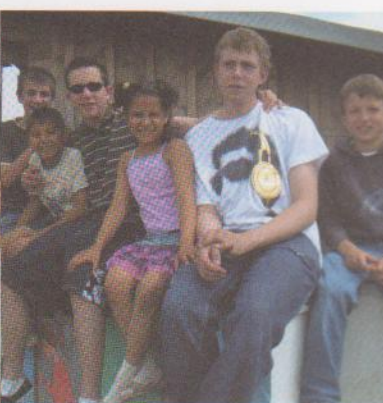
„Europa“: Zwei Kinder des COC, zwei La Taste Mitglieder und ein Junge des Orchesters aus Bonn reiten (nicht auf dem Stier, aber) auf einer Mauer des COC