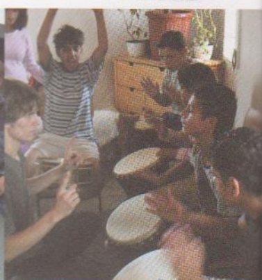
Rumänische Trommler während des Musikworkshops