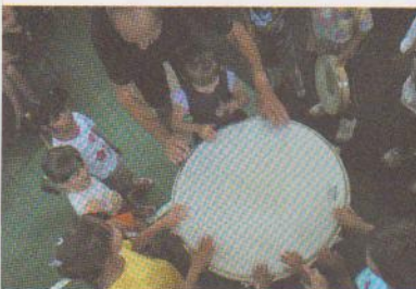
Orchesterleiter Paul Schendzielorz bei der Workshoparbeit mit den Kleinsten des COC