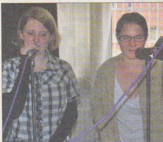
Die Bandmitglieder erhalten auch Gesangsunterricht zur Vorbereitung auf die Arbeit in der Gruppe. Hier zwei junge Sängerinnen von „La Taste“.