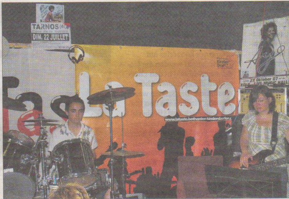
Die Band „La Taste“ bei den Proben für ihr Jubiläums-Open-Air-Konzert.

Spezielle Begabungen und Fähigkeiten der Kinder werden aufgegriffen und unterstützt. Musik sei nicht nur Kommunikation, sondern in erster Linie „Kommunion“ im Sinn von Teilen, Zusammensein. Und genau diese beiden Elemente bildeten in der Band ein Konglomerat aus: sich treffen, reden, etwas miteinander gestalten, musizieren, Gefühle einbringen, zeigen und erleben, gemeinsam Auftreten. Davon lebe die Gruppe. Ein Schlagzeuger der Band drückt es so aus: „Unsere Band ist